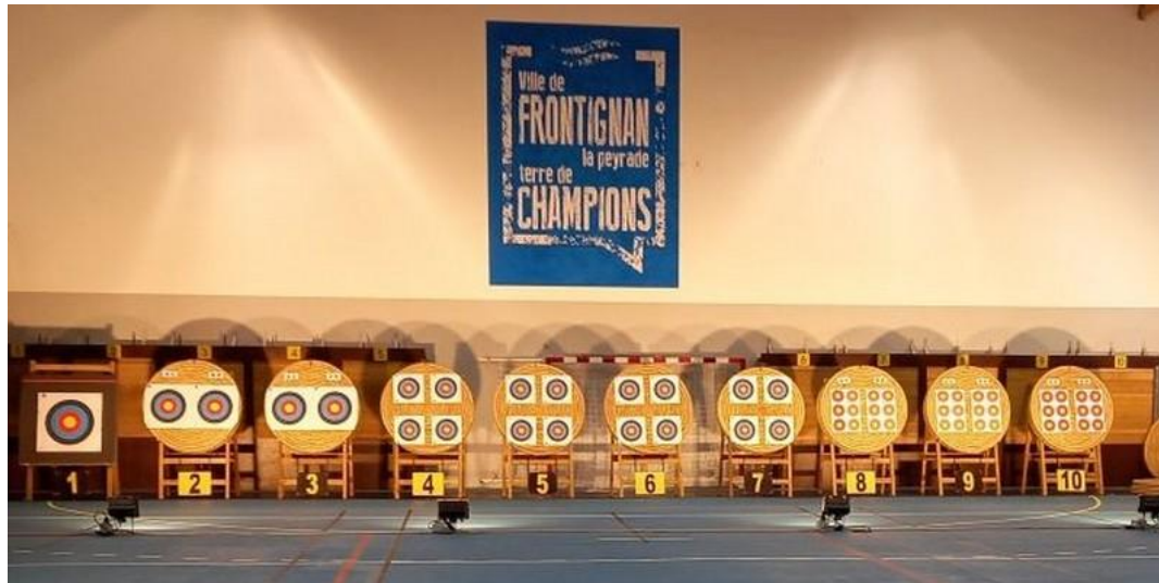
Une reprise pleine de promesses pour les Archers du Soleil de Frontignan

La saison démarre pour les archers du Soleil avec un nombre de licenciés en augmentation et une reprise des entraînements à un rythme soutenu pour les jeunes comme pour les adultes.